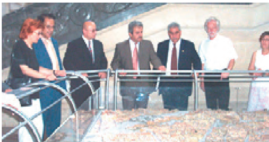
شاندی په‌رله‌مان و حكومه‌تى كوردستان له شاره‌وانى هانفۆه‌ر