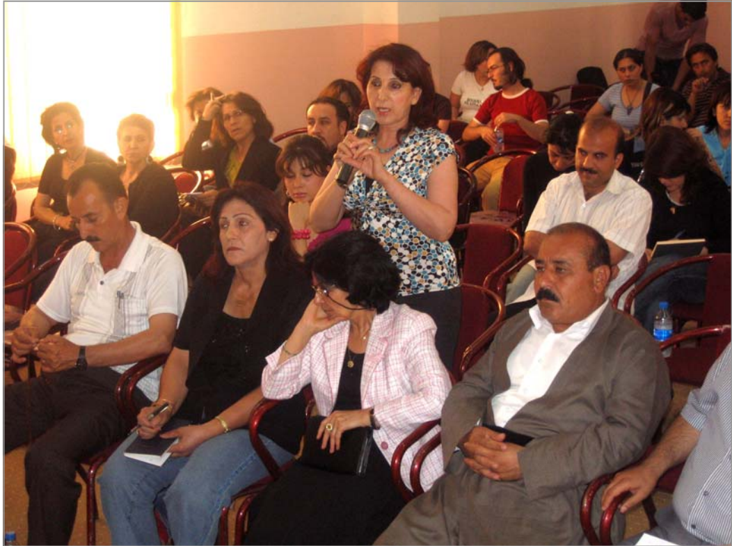
گرته یه ک له کوبونه وه که

شهو له کوبونه وه که دا پیشنیاری شه وه ی کرد که ریکخراوه که ی ده توانیت که سانی پسوپر به نییتو ستافی ده زگای ناوبراوش بنرتسه دهروه. ههر له کوبونه وه که دا بریکاری وهزیری ناوخو، سهرجه م پیشنیاره گانی به هه ند ودرده گرتو وه لامی دایه وه و بریاریش درا که کوبونه وه ی تر له سهر هه مان تهوهر بکرت.