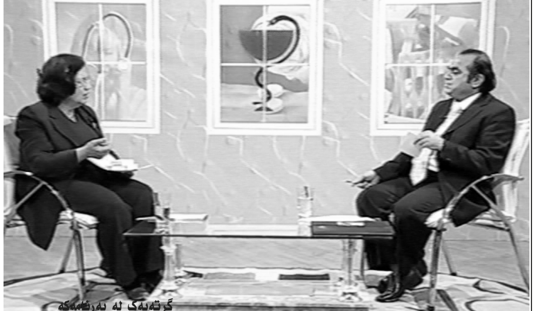
گرتەبەک لە بەرنامەکە

لێچونەوہى سورى مانگانە (تەمەنى ناومیىدى) لەبەرنامەکەى د.عادل حسیندا بە نەخۆشى (کلۆئى ژنان) ناوبرا، بەرنامەکە شەوى ۲۰۰۷/۴/۱۸/۱۷ لە کەنالی ئاسمانى زاگروس پەخش کرا.