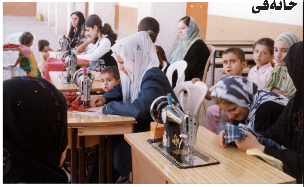
گرتەيەك لە خولى دورومانى نەركەوازى