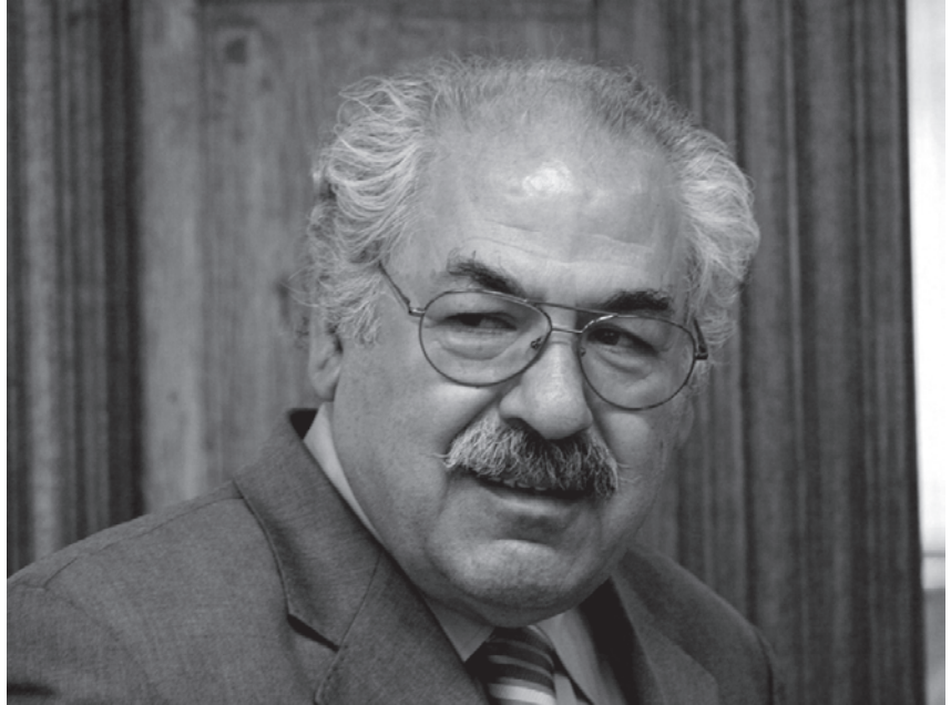
فه له که دین کا که یی

بووم، به به راورد له گه ل ئه وکات ئیستا ئه رکه که گه وره تر بووه به لام له پوو ی ئیمکانیات و وه زعه که ش باشتره، له پوو ی مادی و له پوو ی چه سپاندنی مافه ره واکانمان له ده ستووری عیرا قدا،