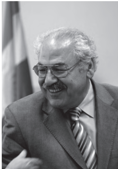
فهله كه دین كاكه يى

ژيرخانه دامه زرينين، ئه وكات ده توانين هه ليش بهر خستين بۇ هونه رمه ند و نووسه ر و شانق كار و ئه وانى تريس