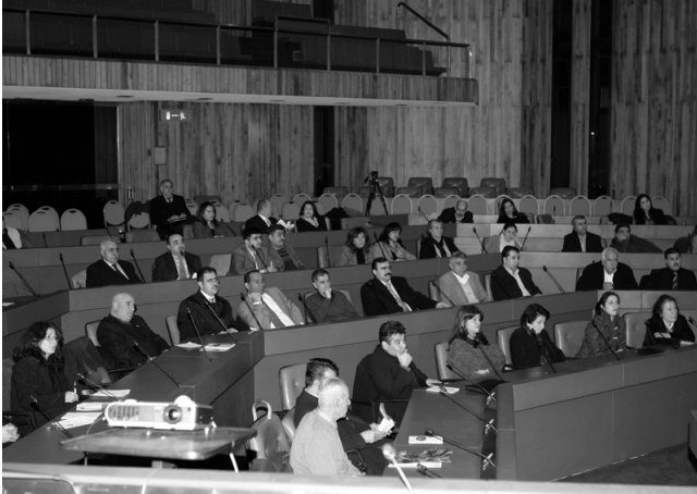
به‌شێک له ئاماده‌بوونی کۆره که

کردنه‌وه‌ی ئۆفیس‌ه‌کاندا ئه‌و لایه‌نه‌ش له‌به‌ر چاو بگرن، له لایه‌کی تریشه‌وه به‌ نیشه‌ت ئێمه‌وه گرنگترین بواری ده‌بیت بایه‌خێکی زۆری پێ بده‌ین بواری ژێرخانی کشتوکالییه له کوردستاندا، ئه‌و بواره‌ش به‌شی سه‌ره‌کییه به‌نامه‌ی حکومه‌تی هه‌ریه‌می داها‌توو، که به‌رێز کاک نیچیرفان بارزانی سه‌رۆکایه‌تی ده‌کات، ئه‌وه‌ش پێمانوایه پێویسته‌ی به‌هاوکاری و یارمه‌تییه‌کانی نیوده‌وله‌تی هه‌بیت، دیسان له‌ی گه‌شته‌دا قسه‌مان له‌گه‌ڵ ئازانسه‌کان کرد و پێمان وت، راسته ئێوه ئیعترا‌ف به حکومه‌تی عێراق ده‌که‌ن و کاره‌کانتان له