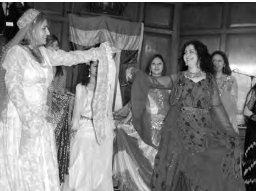
وینهکان: ئەکی بابەمیری و کاردۆ بەسیم