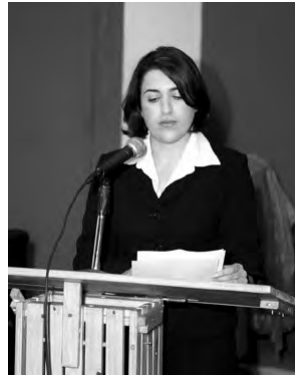
به بیان سامی عه‌بدولرحمان