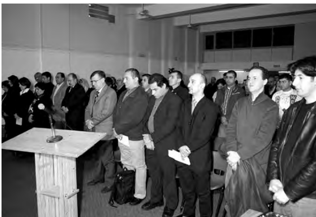
به‌شیک له ئاماده‌بووانی کۆره‌که