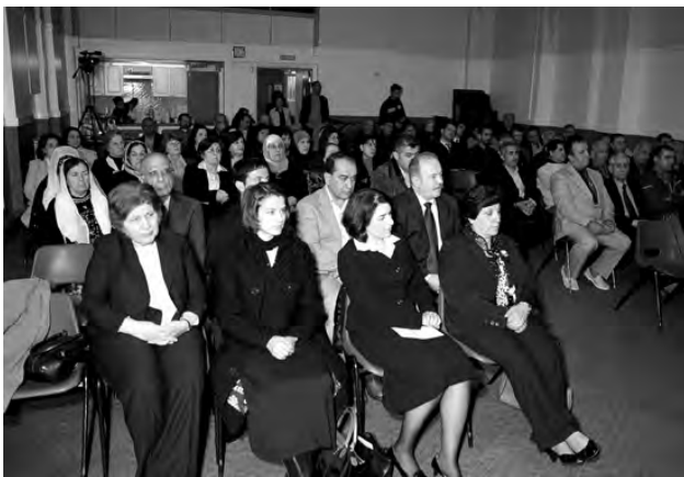
به‌شیک له ئاماده‌بووانی کۆره‌که