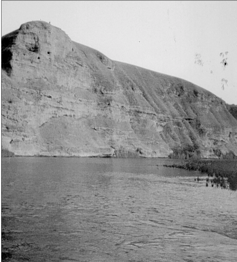
Wêney eşkewtî Qizqepan û Zêy Giçke

Lew maweyeşda Mirad lelay xoyewe komekêkî zoryan pê dekat û le xiwardin û poşak û hemû şitêk