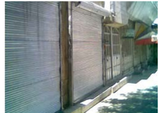
Wêne - Mahabad: Daxistina tev dikan û bazarên bajar di 17'emîn salvegera şehîdkirina rêberê nemir Dr. Qasimlo û hevalên wî Wêneyên pêtir li ser malpera me bibînin