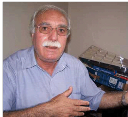
Nivîskarê " ŞÎROVEYA DÎWANA MELAYÊ CIZÎRÎ ", Celalettin Yoyler

Di destpêka pirtûkê de pêşî li ser jînenîgariya Melayê Cizîrî agahî hatine dayîn, mijara jîdayikbûna Melayê Cizîrî li gorî hesabê ebcedê