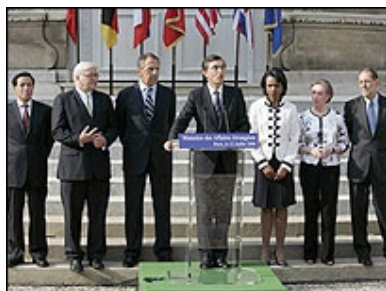
Kongreya Çapemeniyê ya welatên 5+1 li Parîsê piştî bi dawî hatin civînê

Komara Îslamî dixwaze bi vê cure diplomasiyê tenê demê bikire û bîkujê, hetanî bikare bi qasê hewce Uraniyûmê bi dest bixê û çekên Etomî çê bike. Ev gava Îranê gef û xetereke mezin bo ser tenahî û aştiya cihanê û herêmê ye. Ev rejîmê dixwaze civaka navneteweyî bixapîne.