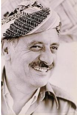
Siyasî R. 4-6