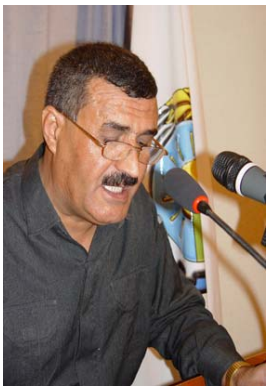
Siyasî R. 2