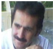
Çand R. 10

Kurdan Di 17'emîn Salvegera Şehîdkirina Dr. Qasimlo û Hevalên Wî De