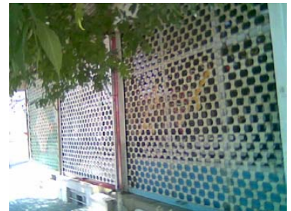
Daxistina dikan û bazarên Mehabadê

Li gor agehiyên gihiştî bi me, xelkê piraniya bajar û herêmên cur bi cur yê Kurdistanê di bersiva daxwaza PDK Îranê de bi awayekê bê wêne dest avêtin daxistina dikan û bazaran û çirayên malên xwe seet