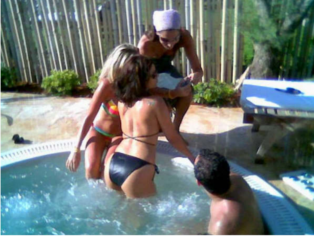
عایشین بفلوس الشعب الی نهبوها من العراق.. . ویرسلون العرب السفله حتی یفجرون انفسهم الکرهیه فی وسط مدننا