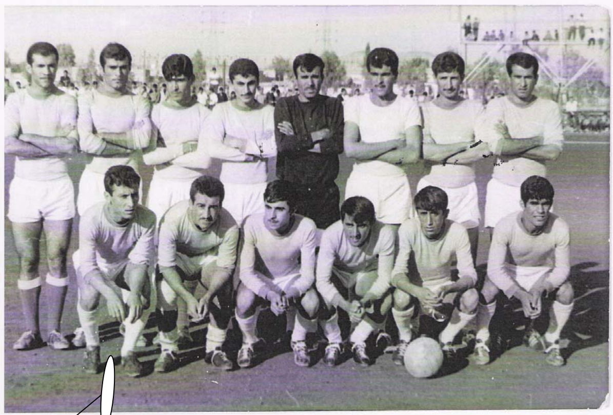
عومەر په زا